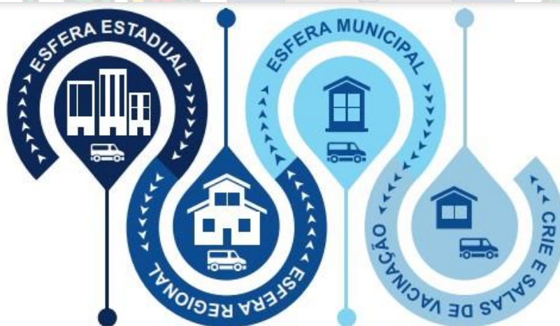
Figura 1: Desenho da rede de distribuição de imunobiológicos no estado de Pernambuco

O processo logístico que envolve a cadeia de frio considera aspectos inerentes a conservação das características originais dos imunobiológicos desde o laboratório produtor até o usuário final. No estado de Pernambuco, após o recebimento da carga mensal oriunda do nível central do Ministério da Saúde, o roteiro de abastecimento percorre por via terrestre para atender oportunamente as instâncias das regionais de saúde (11), municipais (184), Centro de Referência de Imunobiológicos Especiais - CRIE (1) e salas de imunização (2.472) (Figura 1)